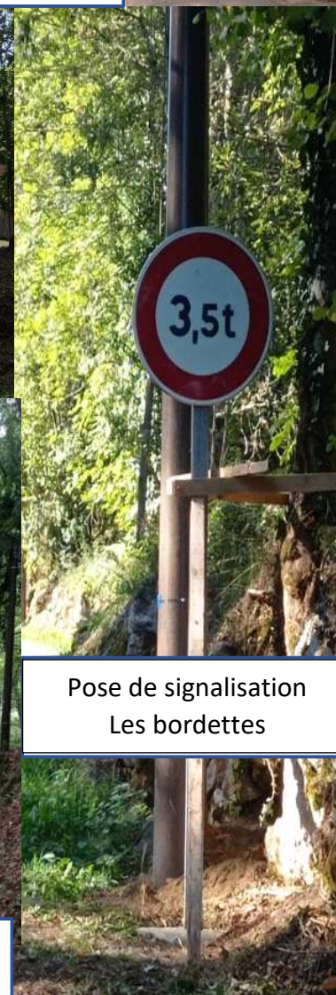
Pose de signalisation Les bordettes