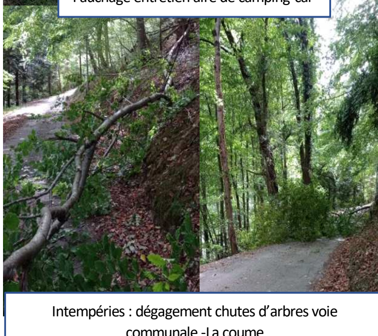
Intempéries : dégagement chutes d'arbres voie communale -La coume