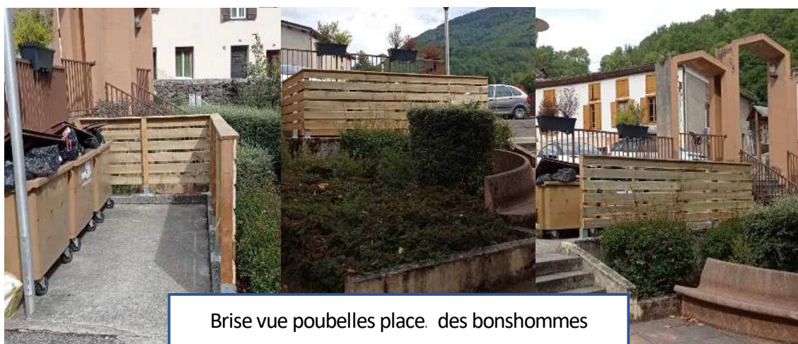
Brise vue poubelles place. des bonshommes