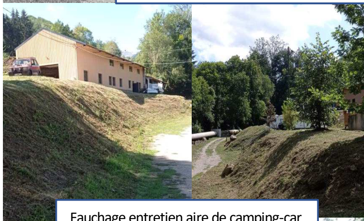
Fauchage entretien aire de camping-car