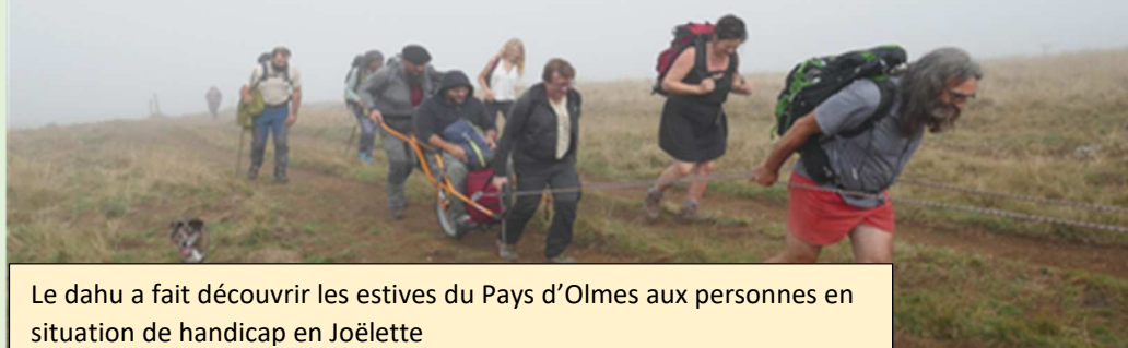
Le dahu a fait découvrir les estives du Pays d'Olmes aux personnes en situation de handicap en Joëlette