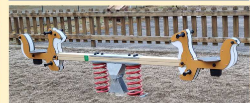
Nouveau : City park