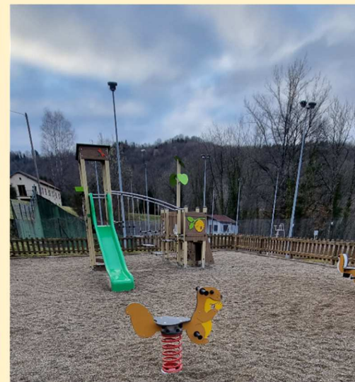
Remise à neuf de l'aire de jeux