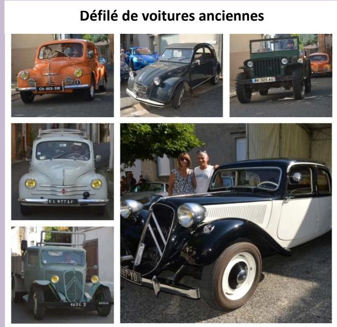
Défilé de voitures anciennes