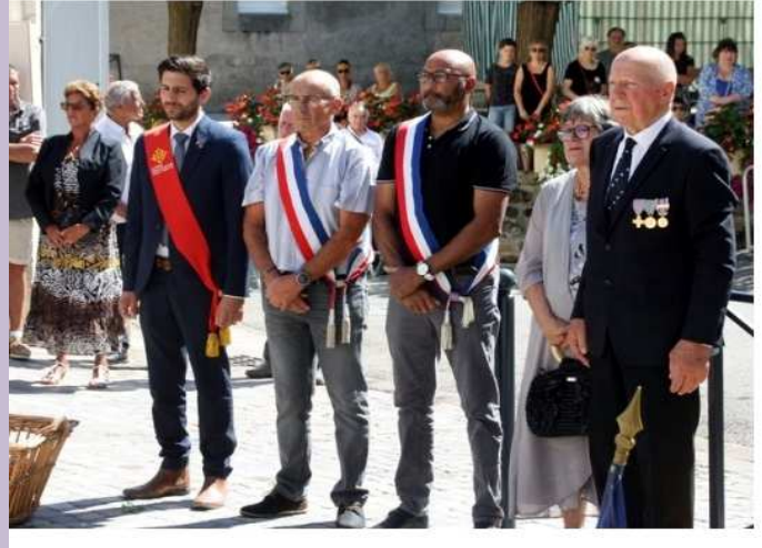
La fête de la Saint-Louis est venue clôturer les festivités locales