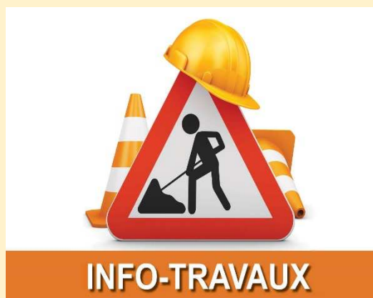
Enrochement sécurisation-Les bordettes